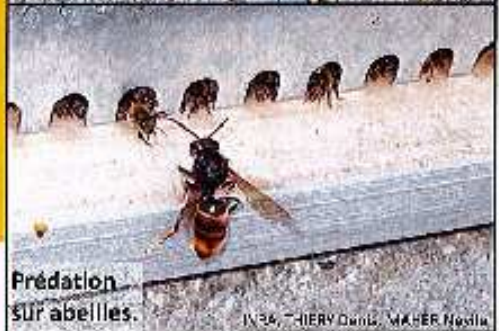
Prédation sur abeilles.