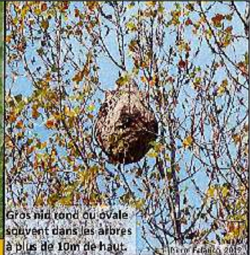
Gros nid rond ou ovale souvent dans les arbres à plus de 10m de haut.